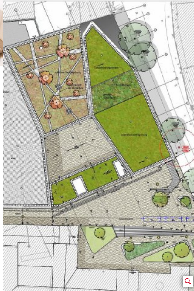
Das Rathaus von oben: zum Neumarkt hin (rechte Seite) soll das Dach begrünt werden, auf der Seite zur Schulstraße hin (grauer Streifen) soll die Photovoltaik-Anlage hinkommen.

Mit höheren Ausgaben zu Buche schlägt auch die Verwendung von qualitativ hochwertigerem Materialien beispielsweise für Innenwände, Fenster, Bodenfläche und Fassade. Der Arbeitskreis habe sich damit sehr intensiv befasst. „Ein in der Anschaffung teurerer Werkstoff kann langfristig der wirtschaftlichere sein. In solchen Fällen lohnt es sich, jetzt zu investieren, um dann in den nächsten 50 Jahren Kosten im laufenden Betrieb einzusparen“, heißt es in der Mitteilung der Stadt dazu. Dies bedeute eine große Entlastung für künftige Generationen.